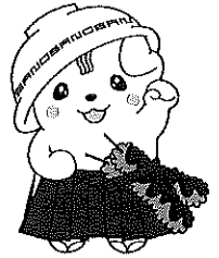
佐野ブランドキャラクター さのまる©佐野市

ふたつの条例が7月1日に施行されることにより記念講演会を開催します。 生きがいを持って地域で生き生きと生活できるよう、一緒に健康づくりに 取り組み、健康寿命を延ばしましょう！